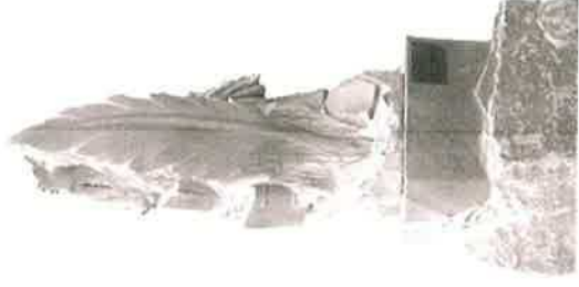
"Et l'histoire continue..."

Sculpture monumentale en marbre de Saint-Béat, Serge Sallan