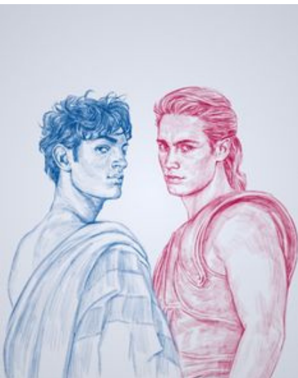
dessin d'Achille et Patrocle avant la grec pride