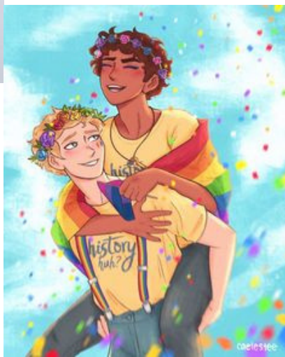
dessin d' Achille et Patrocle à la grec pride